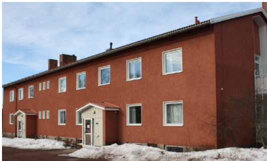
1960: Gamla internatet Arkitekt Ruben Lindgren