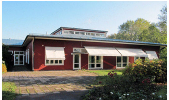
1977: Nya skolan Arkitekt Carl-Johan Slotte