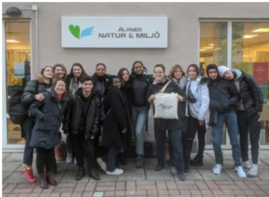
Studiebesök från Bryssel.