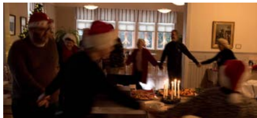
Luciafirande med juldans