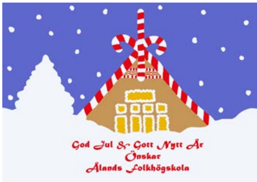
Skolans julkort 2019 gjordes av Angelina Eklund